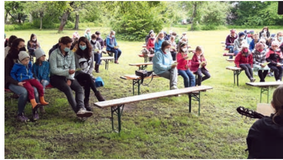
Gottesdienst unter freiem Himmel.