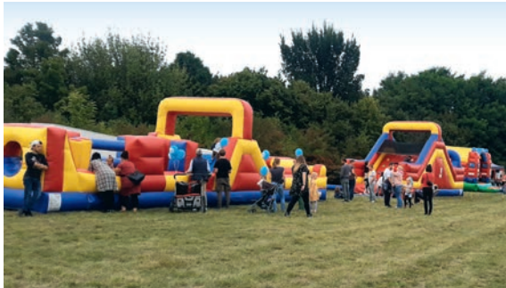
Jugendferientage in Bad Belzig.