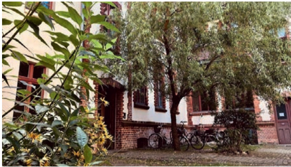
Der CVJM Brandenburg hat seit 2021 wieder eine hauptamtliche Mitarbeiterin