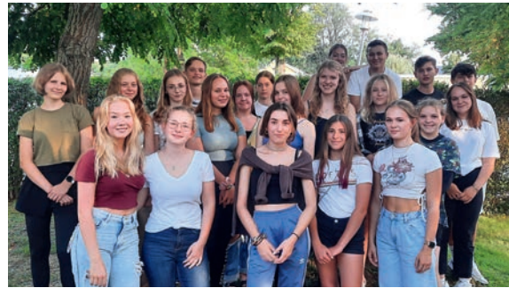
Musste sich 2021 wieder neu finden: TEN SING Zeuthen