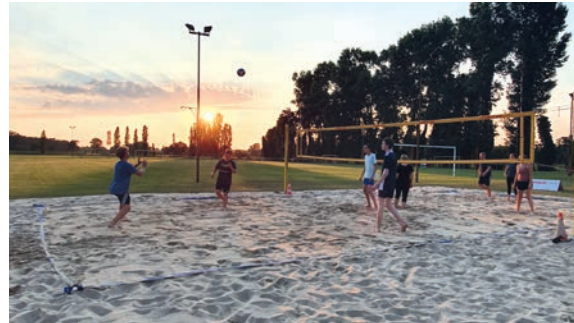
Beachvolleyballturnier bei „Groß Kreuz bewegt“.