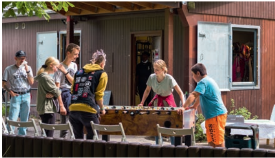
Jubiläumfest im Jugendhaus Baracke