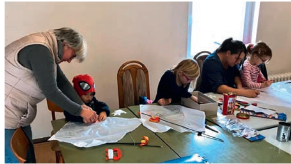
Drachen basteln im CVJM BLiP