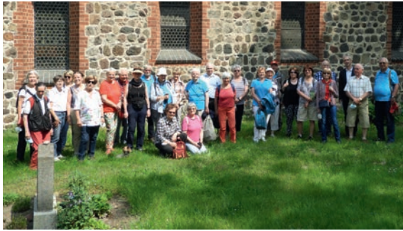
Erster Kirchwanderweg in Brandenburg