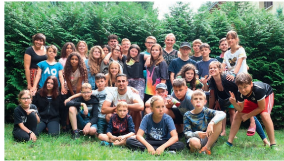
Spaß auf dem Summercamp