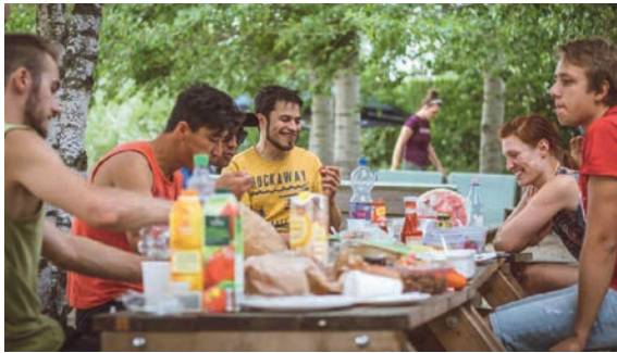
Gemeinschaft im CVJM Potsdam.