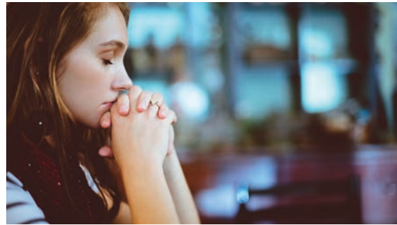
Im Gebet mit dem CVJM-Ostwerk verbunden.