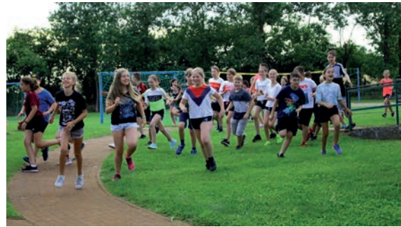
Viel Spaß beim Sport: Kindercamp in Falkenhagen