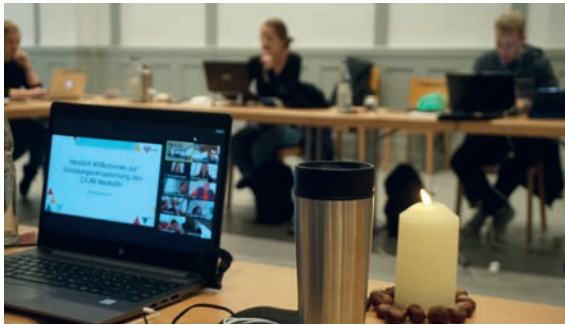
Die Vereinsgründung fand in einer hybriden Form statt