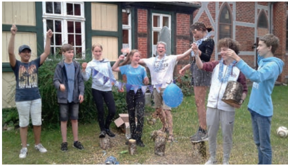
Teenies im CVJM Wittstock.