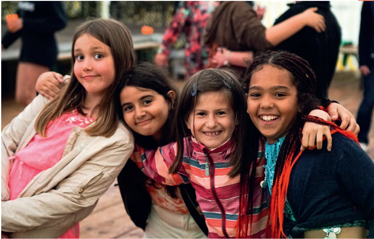
Gemeinsame Erlebnisse verbinden: Mädchen während einer Kinderfreizeit in der PerspektivFabrik 2021.